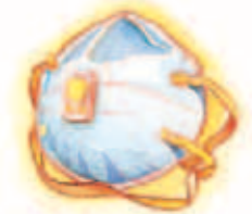
Respirateur au besoin